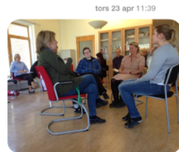
Studiedag på tystberga. Underbara samtal 🙌

Kultur består av människor med värderingar. När vi synliggör våra värderingar och vår kultur i en grupp eller i en organisation kan vi göra det osynliga synligt och pratbart.